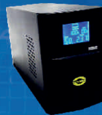
ORVALDI KC-1000L SINUS USB 700W