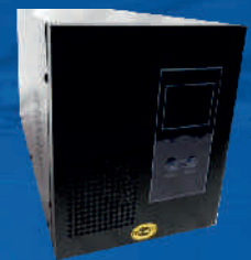
ORVALDI KC-2000L SINUS USB 1,4kW