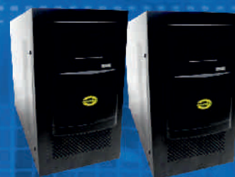
ORVALDI KC-3000L SINUS USB 2,1kW KC-5000L SINUS USB 3,5kW