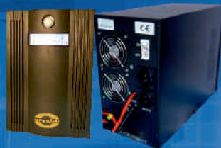
Inwerter ORVALDI INV24-1kW i INV48-2kW