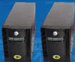
Inwerter ORVALDI INV12-300W i INV12-500W